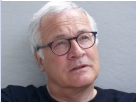
Wilfried von Tresckow

Humanistisches Zentrum Stuttgart Preußentum wird allgemein beargwöhnt als Last der Vergangenheit. Der Vortrag versucht dieses Vorurteil zurecht zu rücken. Eine vorherige Anmeldung wird erbeten bis Freitag, den 18.09. Bitte mit dem Betreff „Preußentum“ an die Mailanschrift: kontakt@dhubw.de – oder telefonisch unter: 0711 6493780.